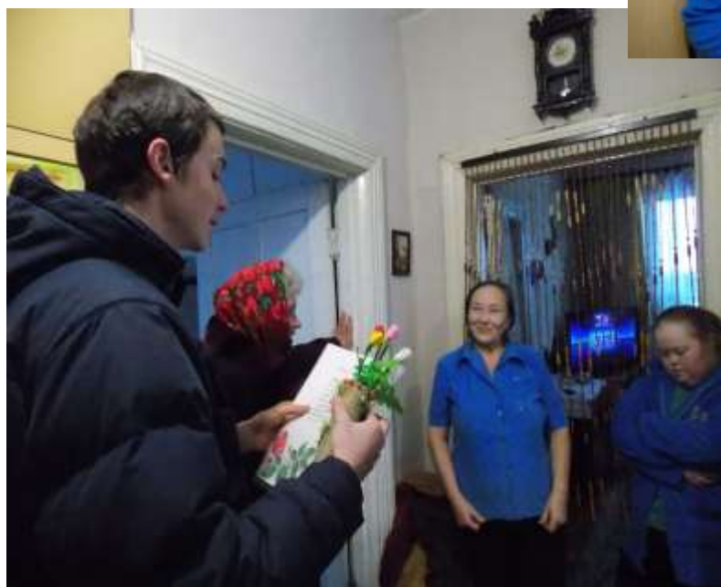
Акция «Поздравь юбиляра» (теплые слова и подарки от волонтеров и муниципального совета инвалидов).