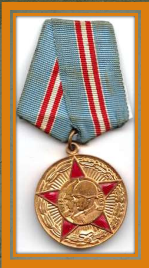
Юбилейная медаль «50 лет Вооружённых Сил СССР»