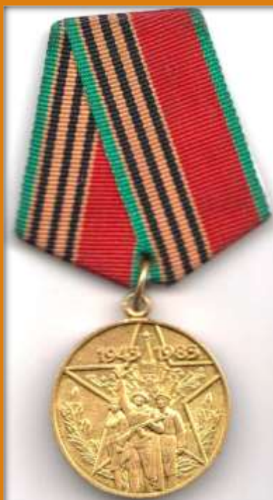
«Сорок лет Победы в Великой Отечественной войне 1941 – 1945 г.г.»