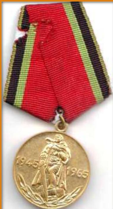
Юбилейные медали «Двадцать лет победы в Великой Отечественной войне 1941-1945 гг.»