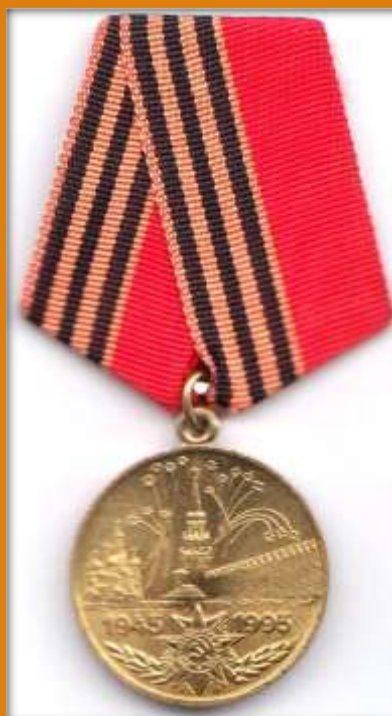
«Пятьдесят лет Победы в Великой Отечественной войне 1941 – 1945 г.г.»