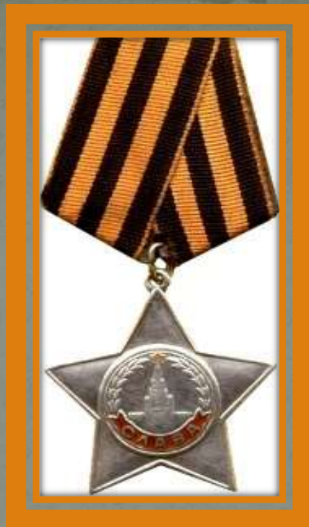
Орден Славы III степени