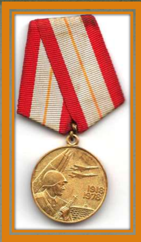
Юбилейная медаль «60 лет Вооружённых Сил СССР»