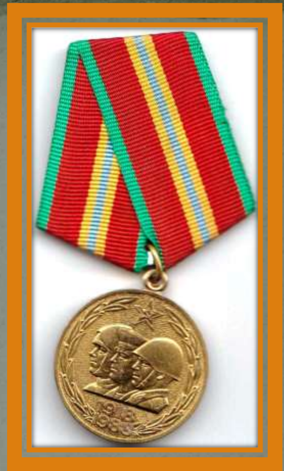
Юбилейная медаль «70 лет Вооружённых Сил СССР»