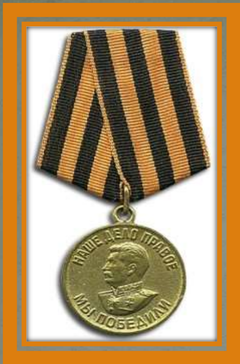
Медаль «За победу над Германией в Великой Отечественной войне 1941-1945 гг»