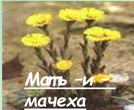
Мать -и - мачеха